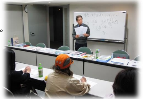
2016年10月の吹田セミナーの様子

生活習慣病（アレルギー、アトピー、糖尿病、高血圧、痛風、便秘など）で苦しんでいる方にとって、重曹が教えてくれる自然の摂理や身体の持つ自然治癒力、地球の浄化システムの情報は、貴重なものとなるでしょう。セミナーでお会いしましょう。